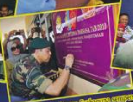
Majlis Perasmian Dewan Serbaguna sempena Program Jira Muzim Ekseles MAUNDO LATIHAN BAKARSA 2010