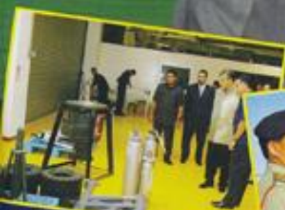
Perasmian Bangunan Baru ZEROC Center Of Excellence