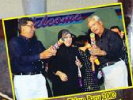
Sambutan Tahun Baru 2010 Wisma Perwira Di Istana Hotel