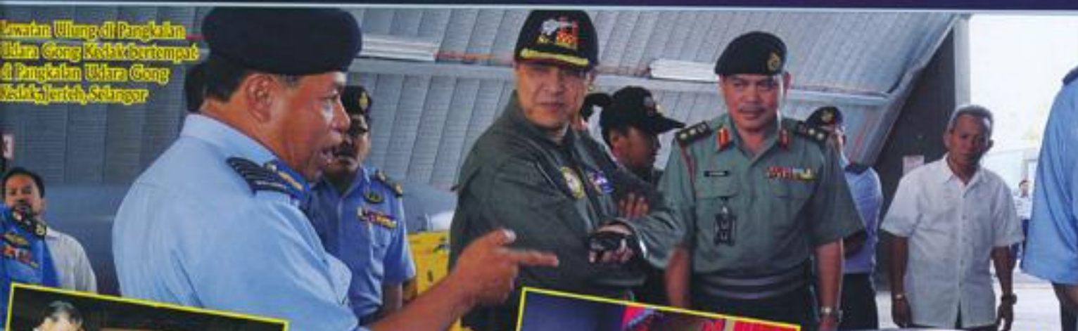
Lawatan Uluang di Pangkalan Udara Gong Kedah bertempat di Pangkalan Udara Gong Kedah, Jeranteh, Selangor