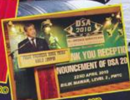
Majlis Penutup DSA 2010