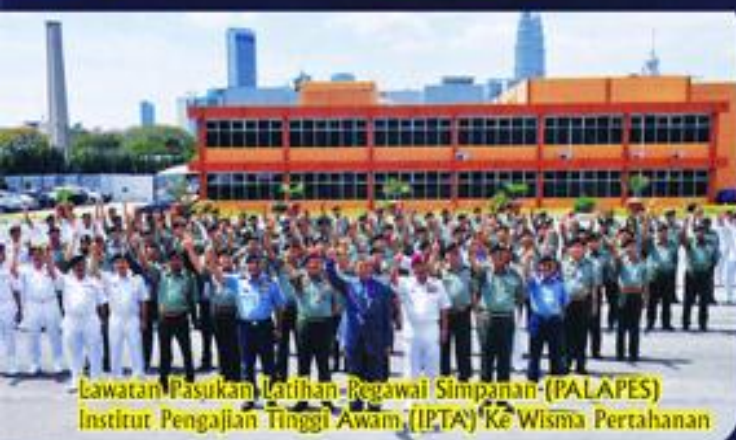
Lawatan Pasukan Latihan-Regawai Simpanan-(PALAPES) Institut Pengajian Tinggi Awam (IPTA) Ke Wisma Pertahanan