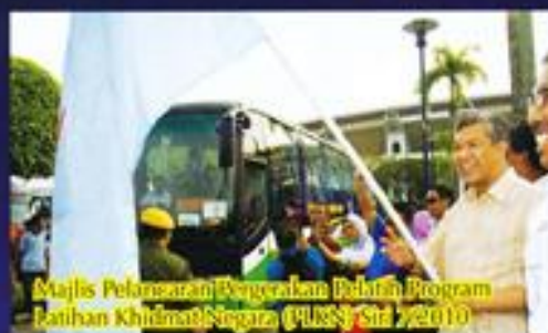
Majlis Pelancaran Pergerakan Baharu Program Latihan Khidmat Negara (PLKN) Siri 7/2010