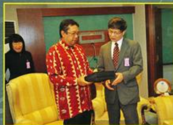
Kunjungan Hormat Daripada Timbalan Menteri Pertahanan Jepun