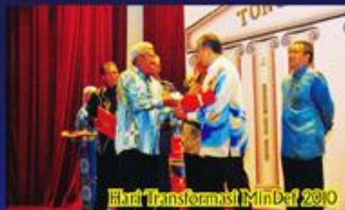
Hari Transformasi MinDef 2010