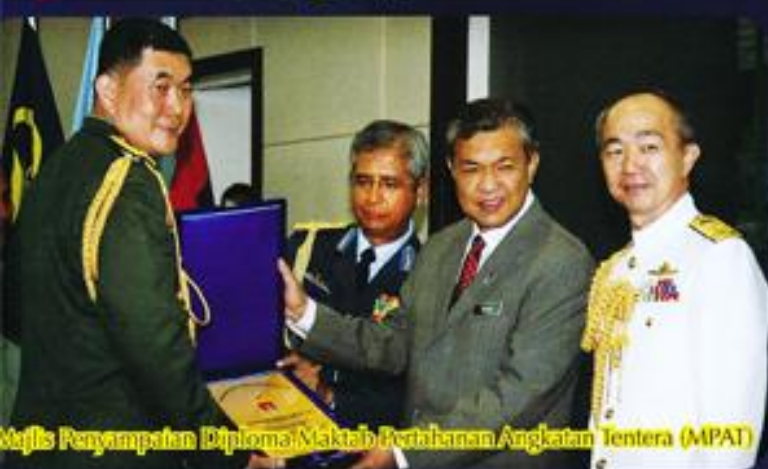
Majlis Penyempatan Diploma Maktub Pertahanan Angkatan Tentera (MPAT)