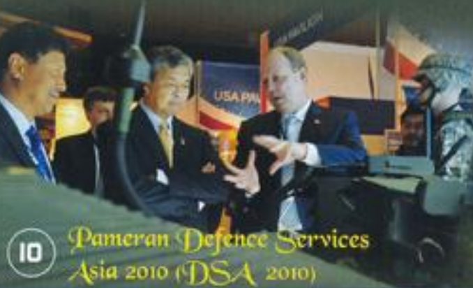
10 Pameran Defence Services Asia 2010 (DSA 2010)