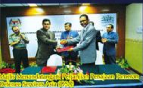
Majlis Menandatangani Perjanjian Kerjasama Pascaan Persekitaran Services Act (PSA)