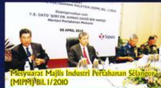
Mesyuarat Majlis Industri Pertahanan Selangor (MIPM) Bil. 1/2010