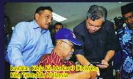
Kawalan Kerja Ke Markas 3 Divisyen Kem Tentera Malaysia