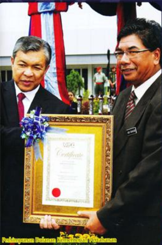
Pedatangan Bulan Kemestuhan Pertahanan