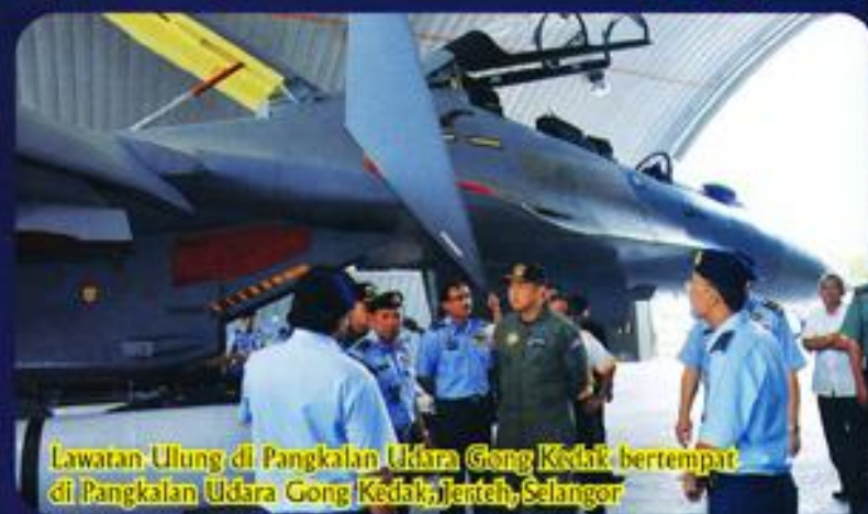
Lawatan Ulung di Pangkalan Udara Gong Kedak bertempat di Pangkalan Udara Gong Kedak, Jentoh, Selangor