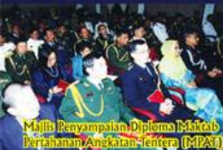
Majlis Penyampaian Diploma Maktab Pertahanan Angkatan Tentera (MPAT)