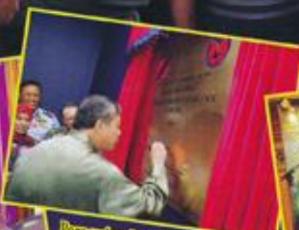
Perasmian Bangunan Baru ZEROC Center Of Excellence