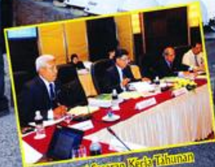
Mesyuarat Sasaran Kerja Tahunan Bencapaian 2009 Dan Cadangan 2010 Kementerian Pertahanan