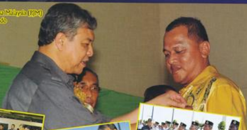
Penyampalan Pingat Jasa Malaysia (PJM) Kepada Veteran Komando Negari Selangor