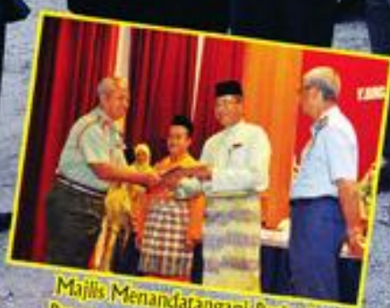
Majlis Menandatangani Perjanjian Program Bajet Mengurus 2010 Dan Pelancaran Stor Bestari Kementerian Pertahanan