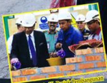
Lawatan Kerja Ke Projek Pembangunan