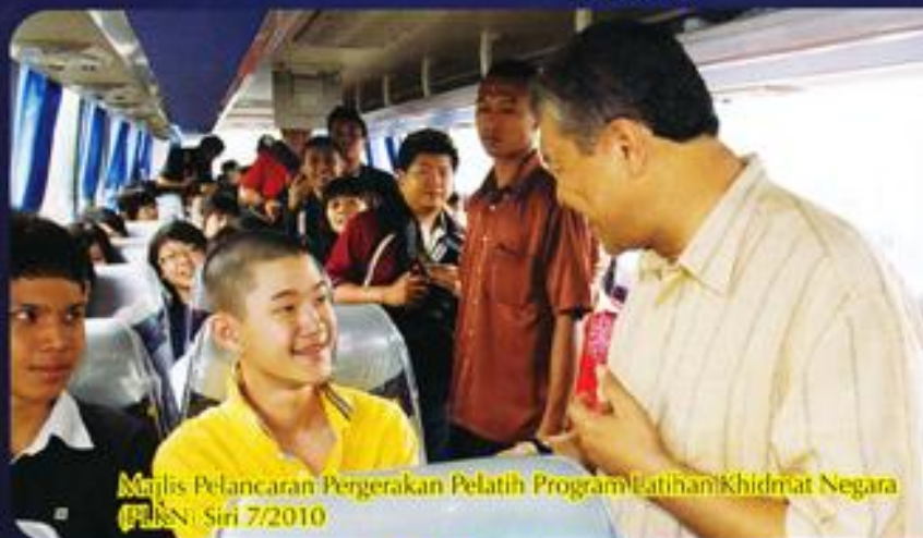
Majlis Pelancaran Pergerakan Pelatih Program Latihan Khidmat Negara (PLKN) Siri 7/2010