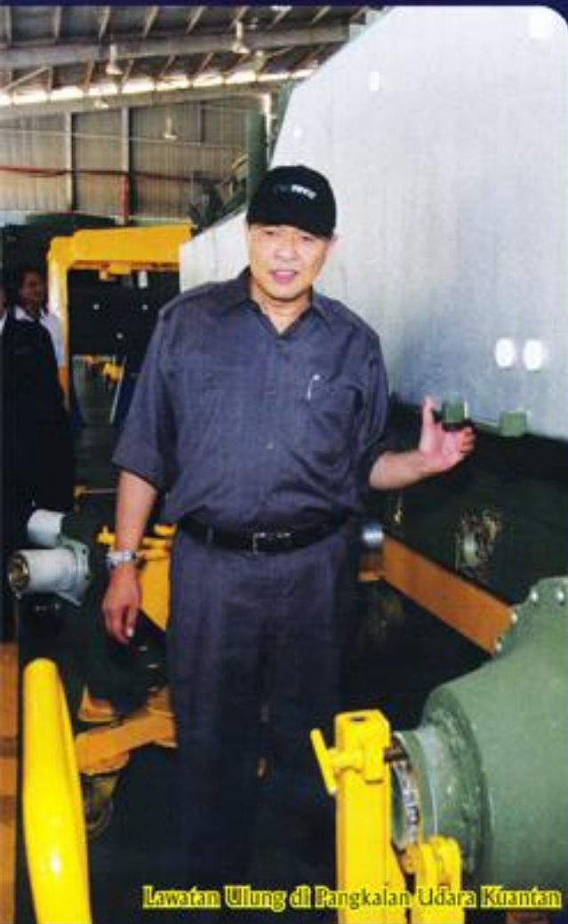
Lawatan Ulung di Pangkalan Udara Kuantan