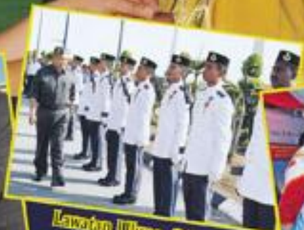
Lawatan Uluang di Pangkalan Udara Komutan