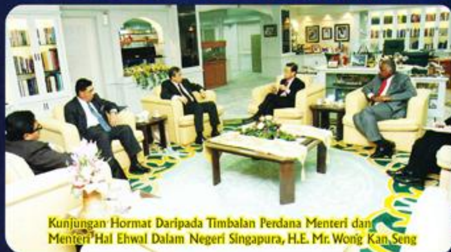
Kunjungan Hormat Daripada Timbalan Perdana Menteri dan Menteri Hal Ehwal Dalam Negeri Singapura, H.E. Mr. Wong Kan Seng