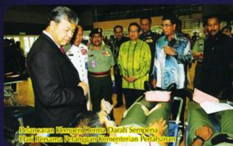
Pelancaran Kempen Derma Darah Sempena Hari Bersama Pelanggan Kementerian Pertahanan