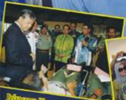
Pelantikan Kejuruan Duta Daran Sempena Hari Bersama Pelanggan Kementerian Pertahanan