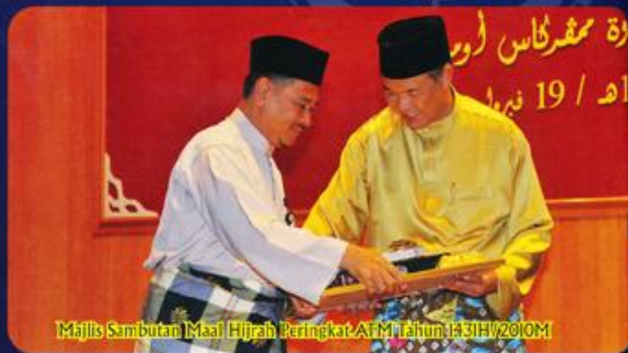
Majlis Sambutan Maal Hijrah Peringkat AFM Tahun 1431H/2010M