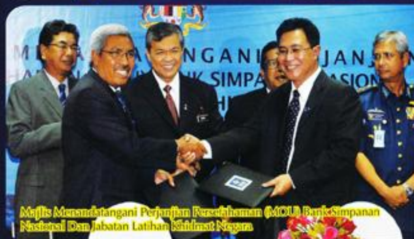
Majlis Menandatangani Perjanjian Kerjasama (MOU) Bank Simpanan Nasional Dan Jabatan Latihan Khidmat Negara