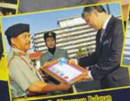
Berhimpunan Bulanan Kementerian Pertahanan