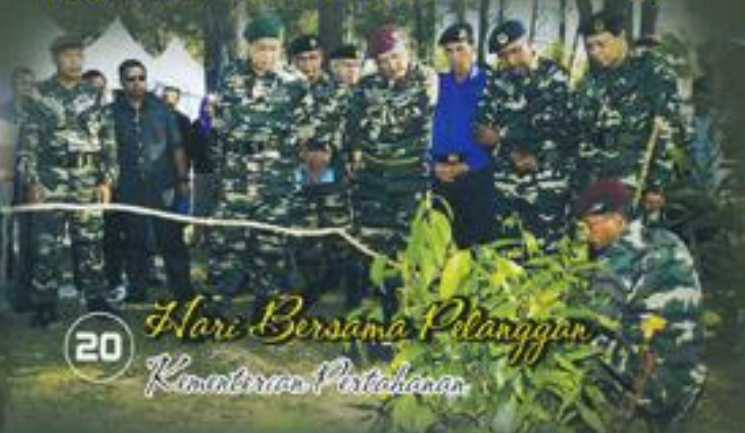
20 Hari Bersama Pelanggan Kementerian Pertahanan